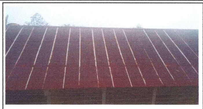
Foto 2: SE OBSERVAN LAS LAMINAS DEL TECHO OXIDADAS, SE NECESITA CAMBIARLAS