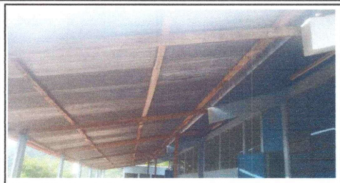
Foto1: SE OBSERVA EL CORREDOR CON COSTANERAS DE MADERAS DAÑADAS, ES NECESARIO SUSTITUIRLO POR COSTANERAS DE METAL