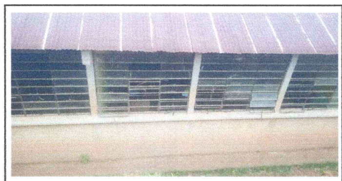
Foto 4: SE OBSERVAN LAS VENTANAS SIN VIDRIO Y LAS ESTRUCTURAS METALICAS OXIDADAS, ES NECESARIO PINTARLAS, REPONER VIDRIOS Y PINTAR PAREDES